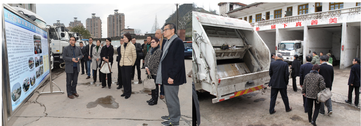
▲訪問團到雅安市環衛處參觀環衛設備