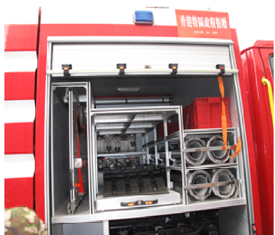
▲雅安市消防支隊展示以特區政府捐款購置的多輛水罐消防車