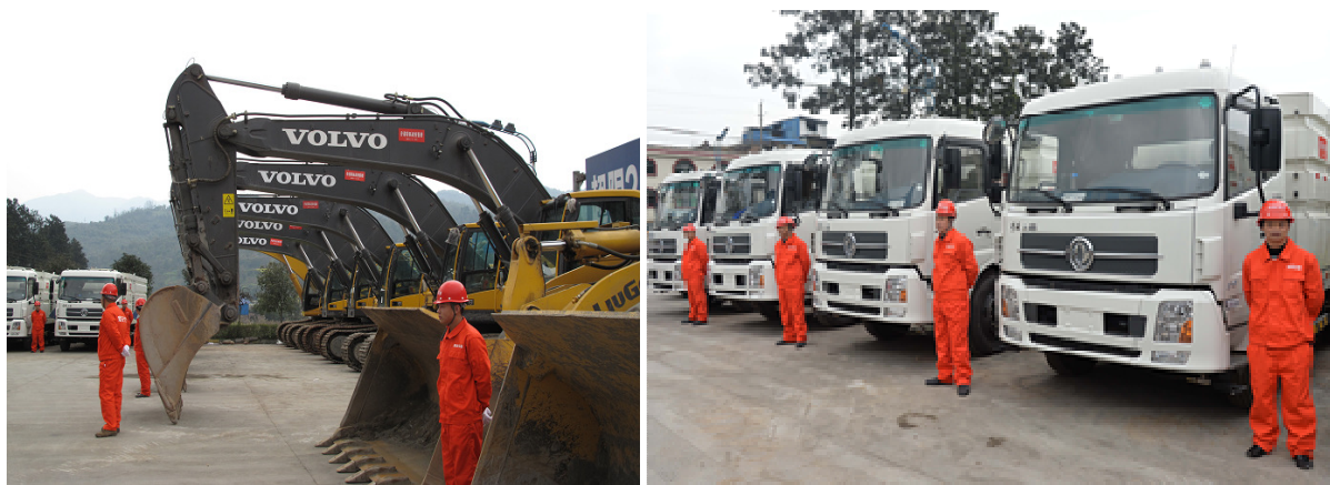
▲ 各款挖掘機及裝載機是最早到位的搶險設備